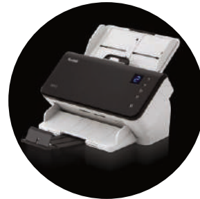
Escáneres Kodak E1025 y E1035

* La velocidad de producción puede variar según el controlador, el software de la aplicación, el sistema operativo, la computadora y las características de procesamiento de imagen seleccionadas.